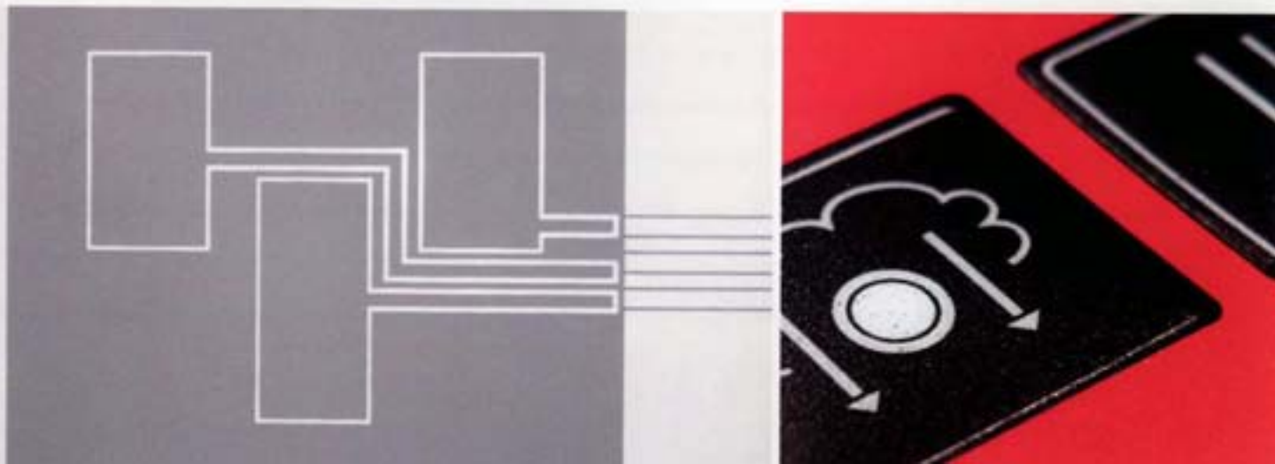
Folienstatur für Spülmaschinen