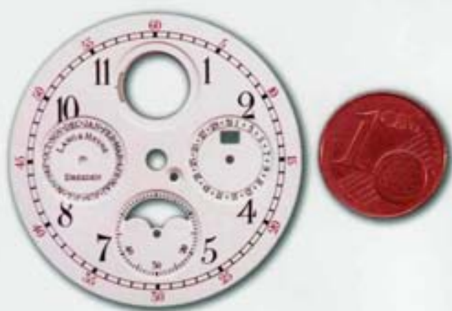
Tampondruck auf Ziffernblatt