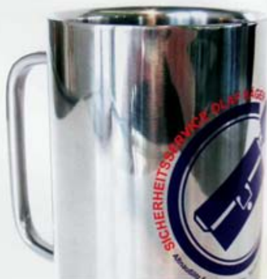
Körpersiebdruck auf Edelstahlasse

Oder auch leuchten, duften, glimmern, strahlen oder kleben. Damit Werbemittel Eindruck machen und Ihre Botschaft haften bleibt, bietet Ihnen der Siebdruck alles, was Drucksachen und bedruckte Sachen edel und stark macht. In der Königsdisziplin - Siebdruck im 40er Raster - erreichen wir hochbrillante und detailreiche Druckergebnisse.