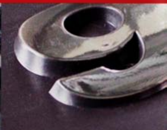
Kunststoffleiste mit Heifolienprgung

Lernen Sie aber auch die vielen anderen Einsatzbereiche des technischen Siebdrucks kennen. Egal ob auf Metall, Kunststoff, Glas, Holz oder Textilien: Mit Siebdruck gelingt die brillante Veredelung und Beschichtung aller Oberflchen!