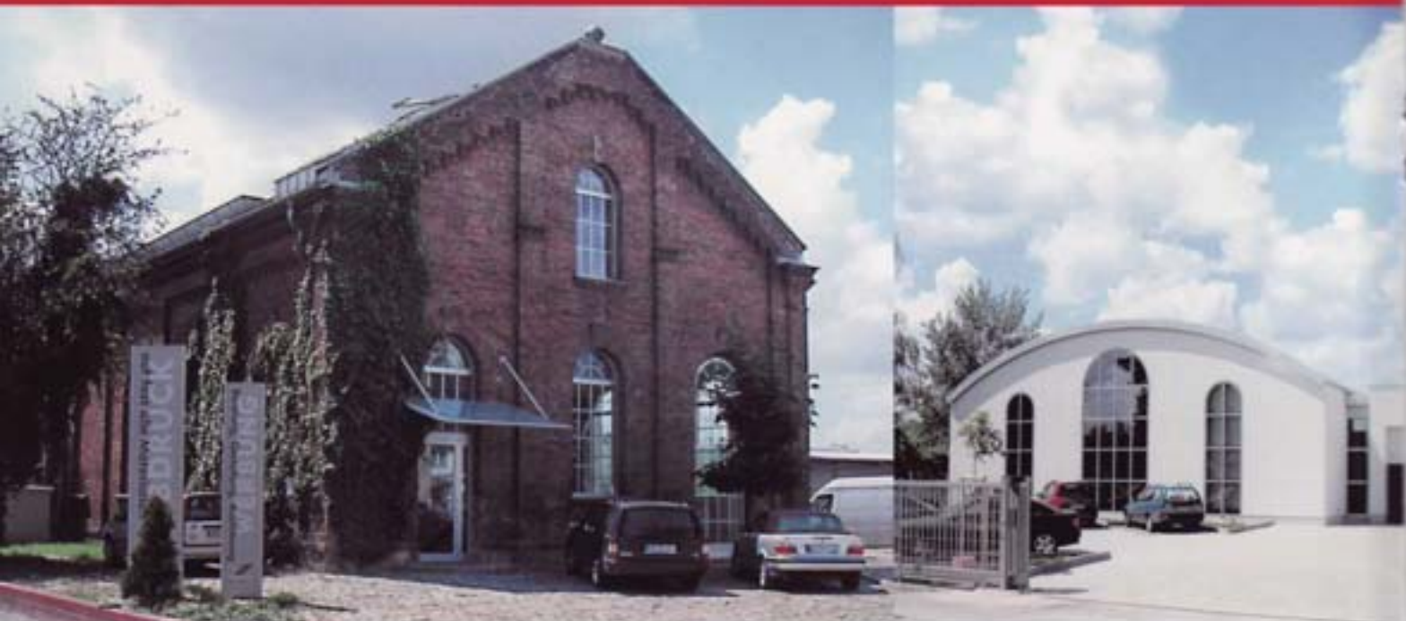
Das Siebdruckhaus. Verwaltungsgebäude und neue Produktionshalle